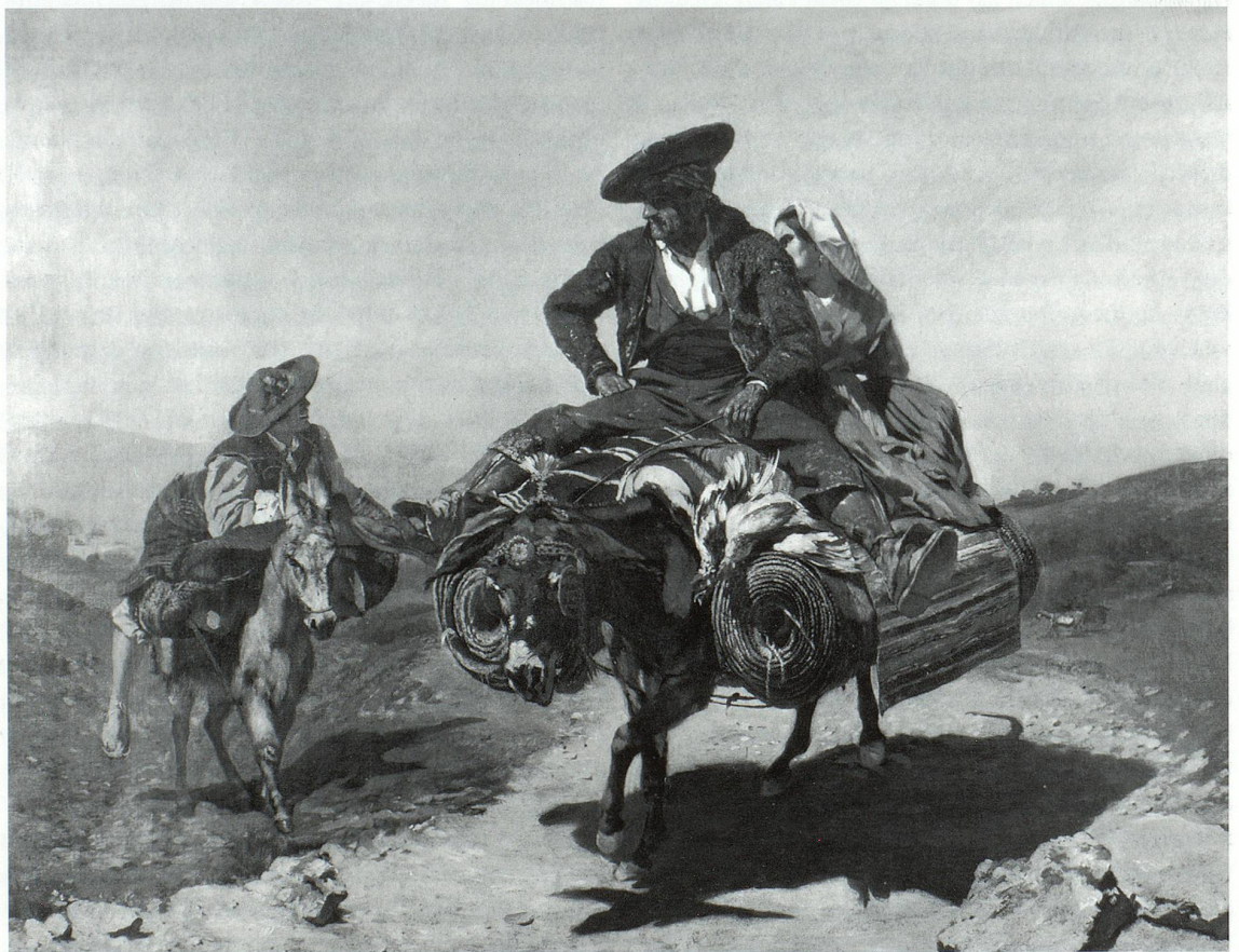
Seite 24 unten: Frank Buchser, «Ritt nach Sevilla», 1861 Robert Baumann, Kunstmuseum Luzern