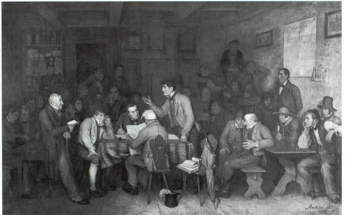
Seite 24 oben: Albert Anker, «Gemeinde- versammlung», 1857. 1867 an der Turnusaus- stellung mittels Bundes- subventionen angekauft. Kunstmuseum Bern