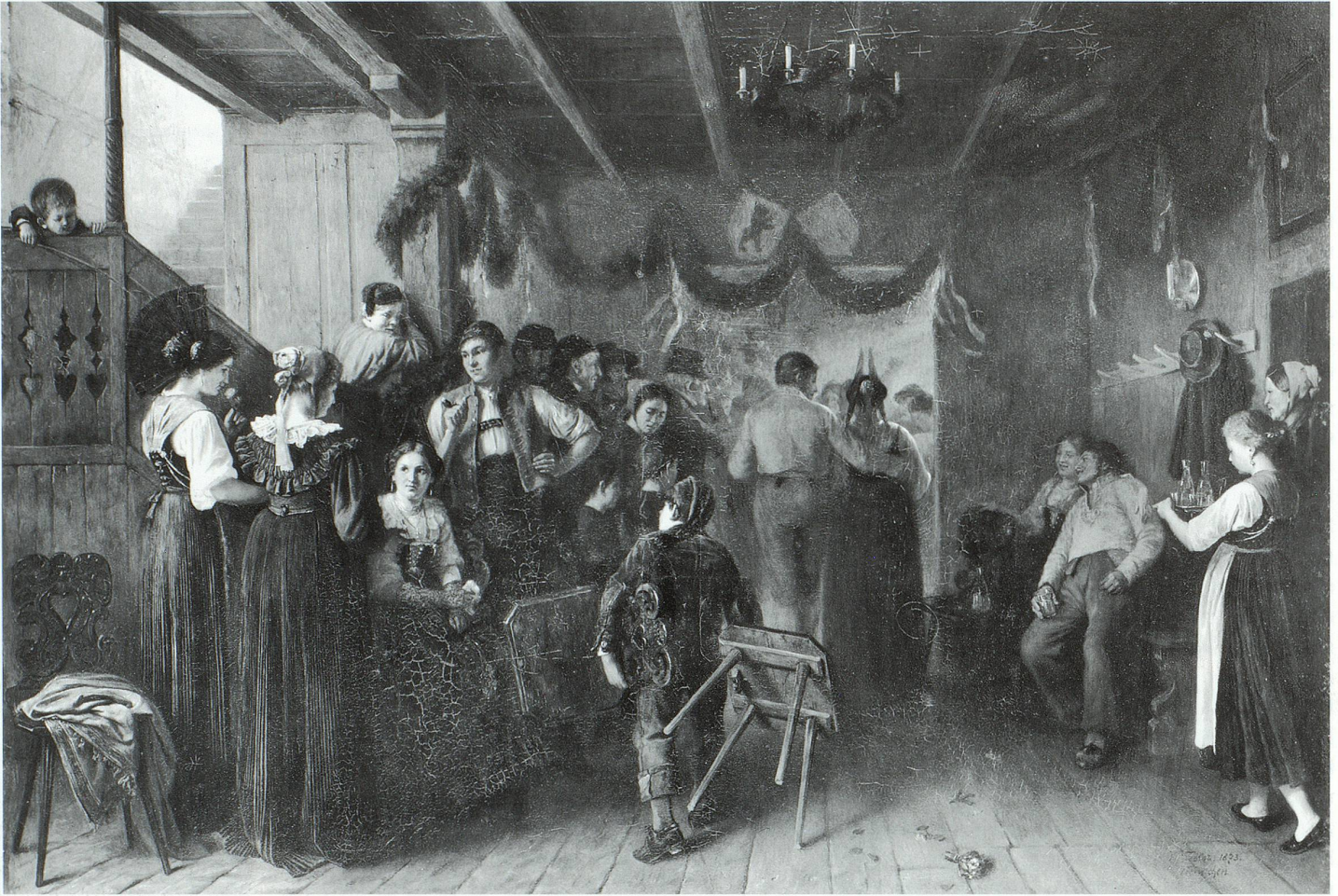
Seite 26: Victor Tobler, «Tanzeten in Appenzell», 1873. Kunsthaus Glarus Schweiz. Institut für Kunst- wissenschaft Zürich

doch gerade in der schweizerischen Landschaft das vorzüglichste nationale Kunstmoment.» Bei dieser Stimme, die den Mangel als Vorzug ausgeben wollte, blieb es. In Zukunft wurde das Fehlen von Gemälden, welche die vaterländische Geschichte verherrlichen, als schmerzlich empfunden. Wiederholt riefen Kunstvereinsvertreter den Staat auf, als Auftraggeber und Mäzen zu wirken. Immer wieder musste die Aussicht auf eine glänzende Zukunft über die magere Kunstgegenwart hinweg trösten: «Noch sprechen wir die Hoffnung aus, dass andere und bessere Zeiten nachholen, was jetzt in unserem vaterländischen Kunstleben noch fehlt und doch einer glücklichen und ruhmreichen Nation nicht fehlen sollte» (Neujahrsblatt der Zürcher Kunstgesellschaft 1853). Eher als Hohn denn als Aufmunterung mussten die seit 1860 ausgerichteten Bundessubventionen in der Höhe von 2000 Franken wirken. Bald wurden aus den Kreisen der Kunstfreunde gehässige Worte laut, man sprach von kunstfeindli-