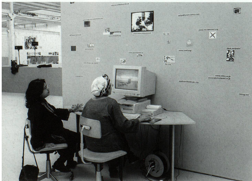
S. 17 «Sex & Space» Shedhalle, 1996