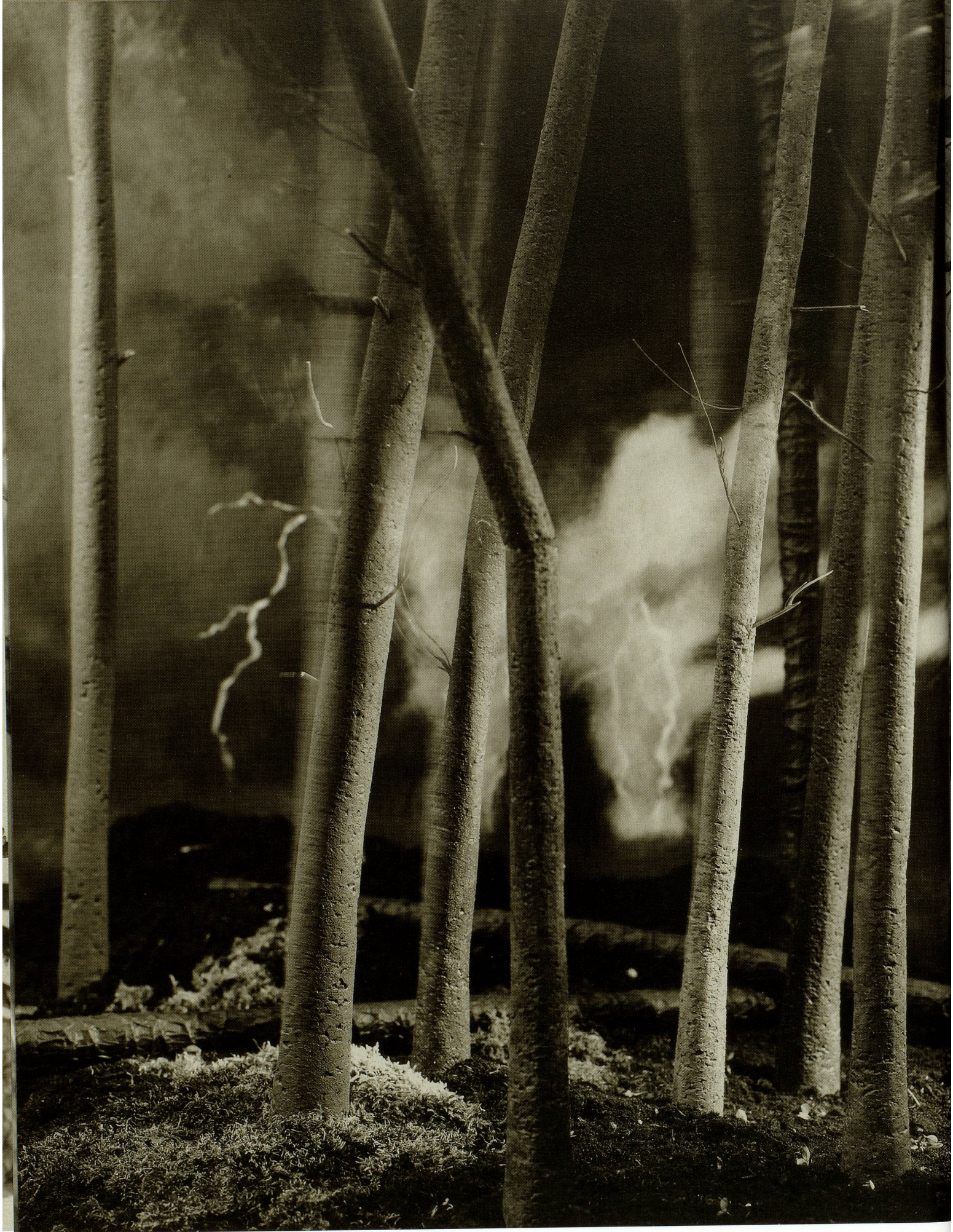
Dann kam noch Lothar