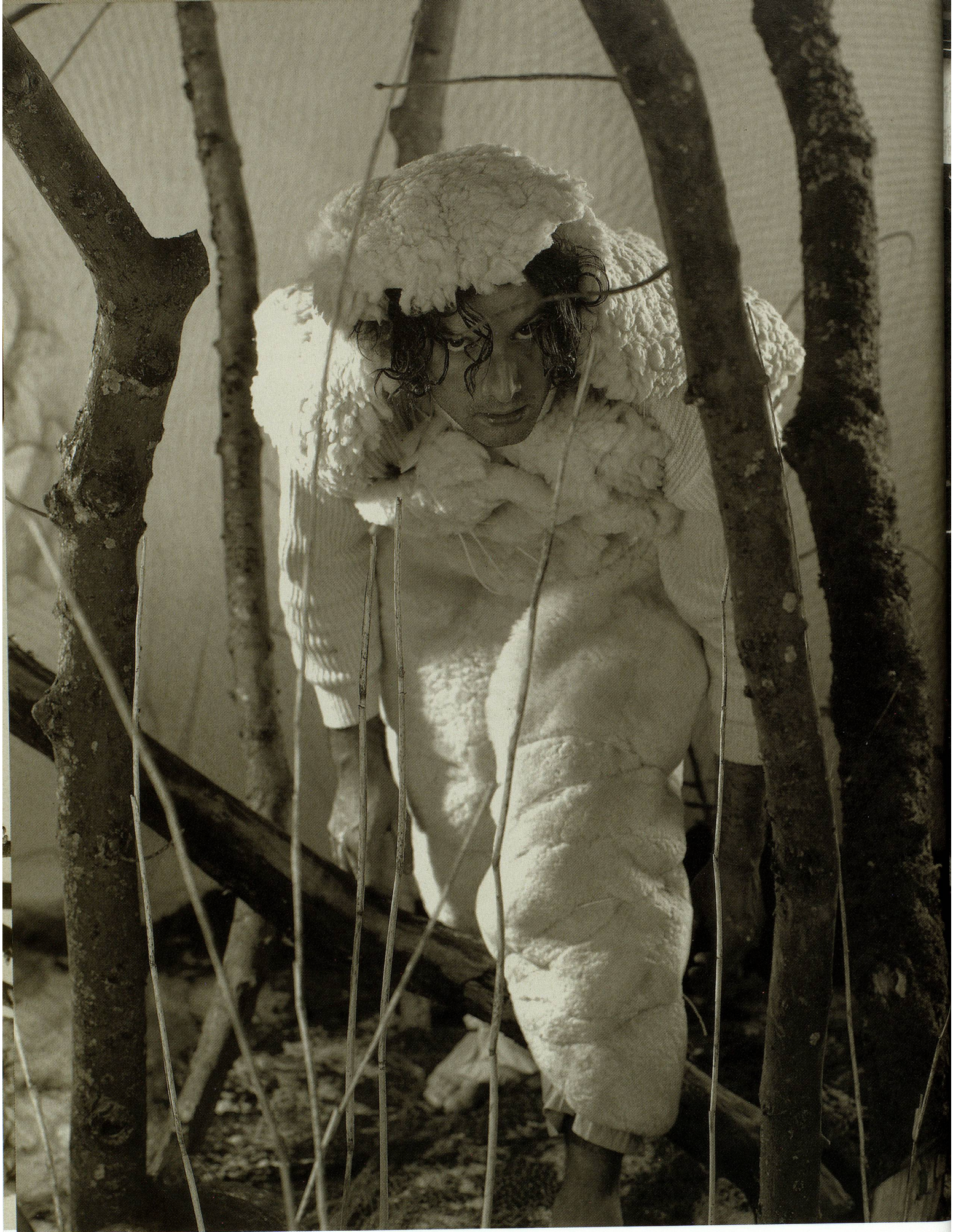
Aber das mit dem Bären klappte nicht so ganz ...