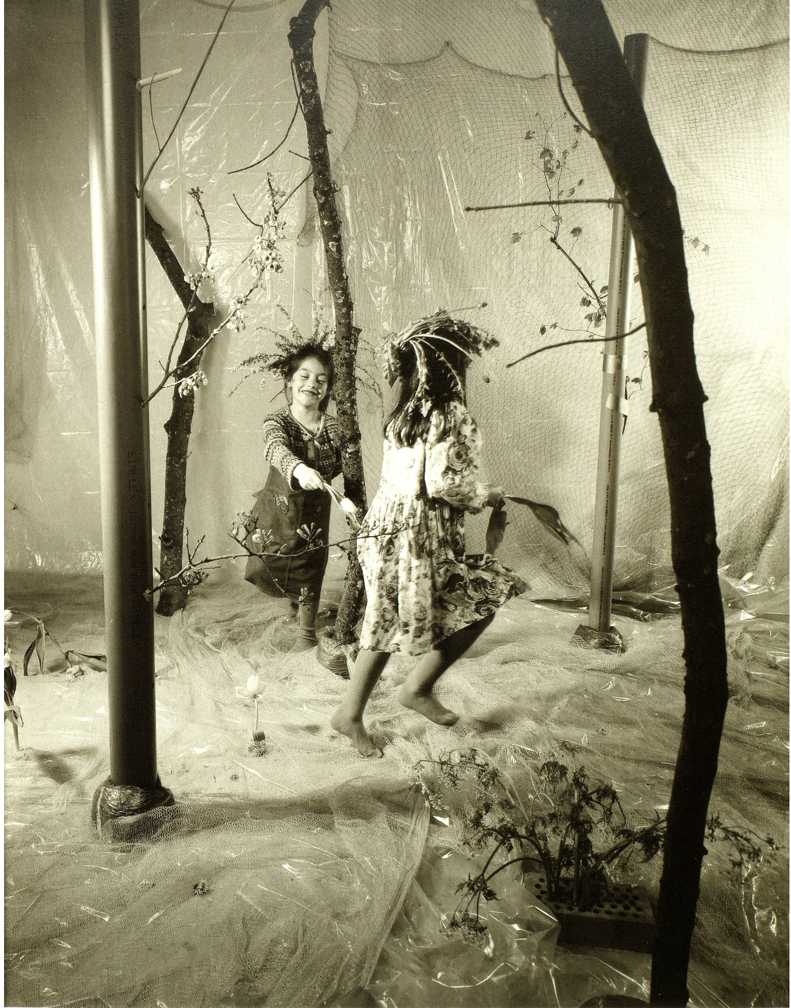
Es sah auch ganz viel versprechend aus