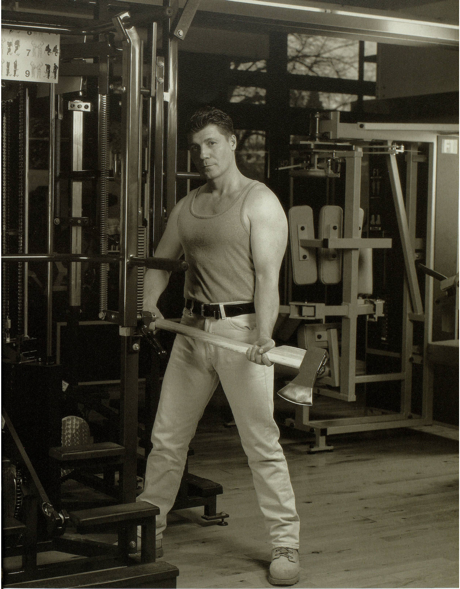
... und das mit dem Holzfäller, naja