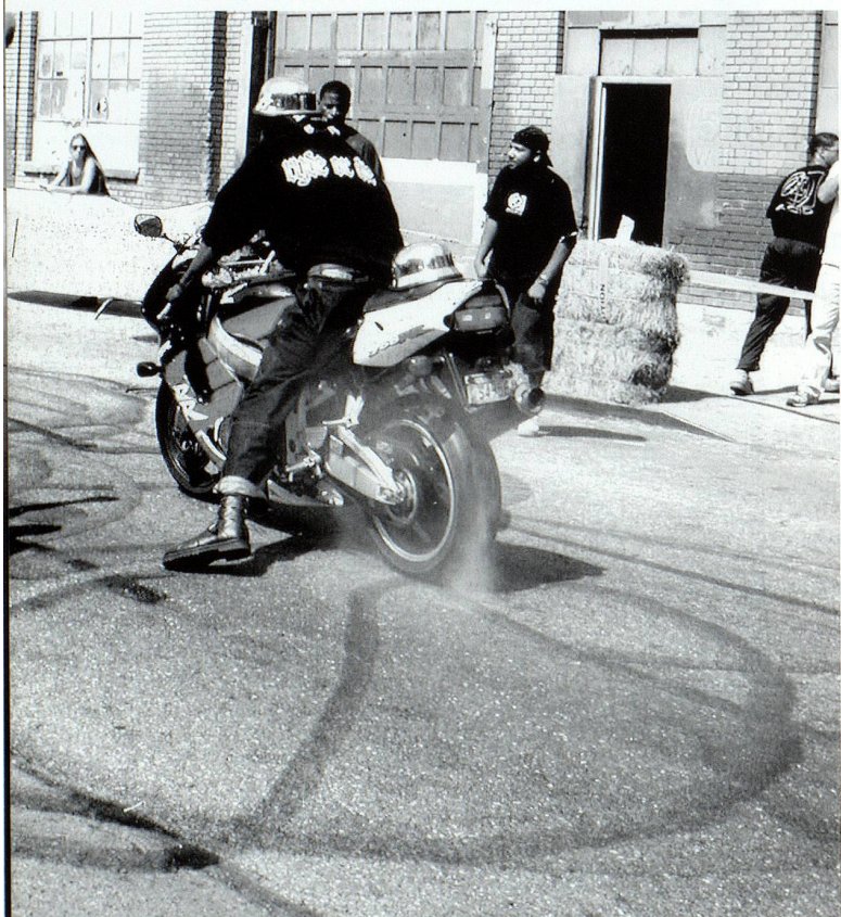
Lori Hersberger, Burnout in Chelsea, 2000, © the Swiss Institute, New York

penings, processions, bannières, installations éphémères, public pris à parti, marquage graphique illicite de type tag, etc. La notion de contexte, ici, s'avère fondamentale. L'intervention ne s'accomplit jamais au jugé, elle implique un principe de confrontation, elle vise l'agrégation ou la polémique, jamais le consentement tacite ou mou. La non-pérennité est aussi le lot des formes d'art public non programmé, dont le destin est de disparaître rapidement. En dérive un art que j'ai pris l'habitude de qualifier de contextuel, activiste et volatil, suscitant l'acquiescement ou l'ire des pouvoirs publics, qui laissent faire ou interdisent selon ce qu'il en est des rapports de force du moment.