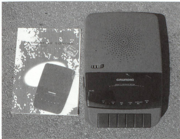
passerelle sonore, février 2003