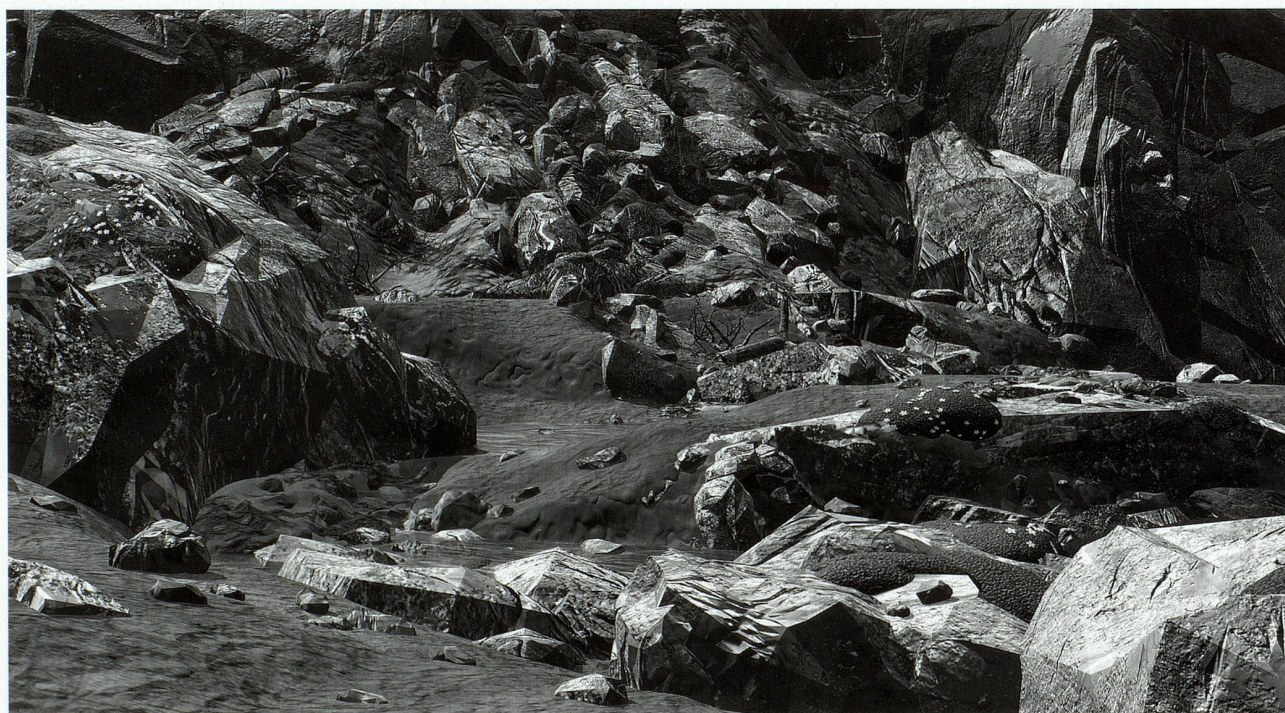
«Geröll», Monica Studer/Christoph van den Berg, 2005 grossformatiger Inkjet-Print/Fotopapier/Alu H 220 cm x B 405 cm (dreiteilig), Kunstmuseum Solothurn

Ist eine temporäre Verlagerung der künstlerischen Tätigkeit ins Ausland notwendig für Schweizer Kunstschaffende? Viele beurteilen die gesammelten Erfahrungen ihrer Auslandjahre als Gewinn für ihre künstlerische Entwicklung, und ein Stipendium für ein Werkjahr im Ausland stärkt nicht zuletzt das Selbstbewusstsein, kommt es doch einer Auszeichnung gleich und ist nicht selten an eine renommierte Institution geknüpft.