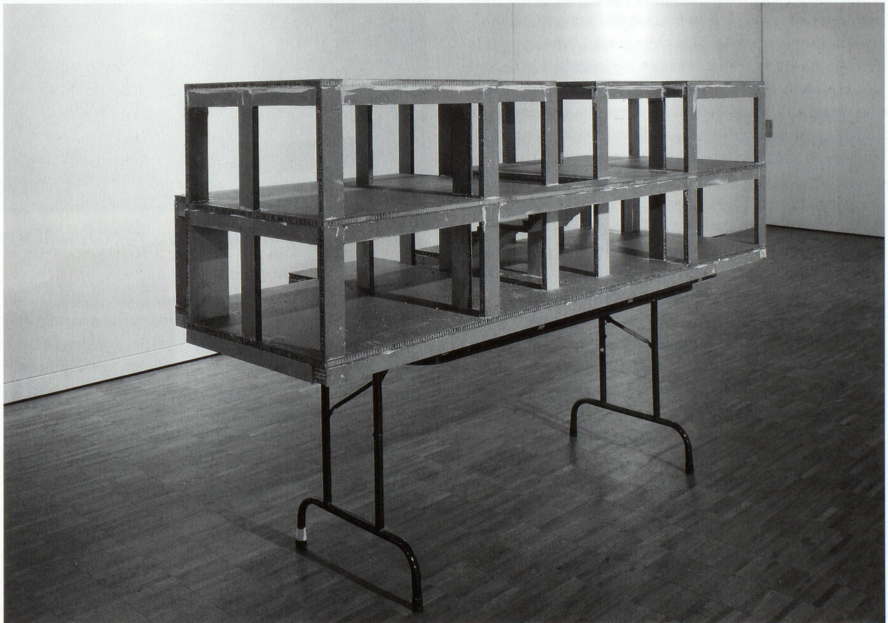
«Skelett», C-Print, 90×110 cm, Jason Klimatsa, 2005

Given all the major changes within creative professions, and the corresponding reforms in Switzerland's education programmes, we have all reason to hope that in the future as well, a solid art studies background will remain closely linked to professional success. The trend among artists to take up multiple studies, together with the attractive palette of postgraduate studies available to them today, all tend to make an artist career a prime example of a life-long learning experience – learning that will include how to be successful in building up a network of contacts and obtaining the necessary funding.