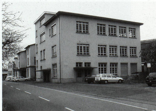
Atelierhaus