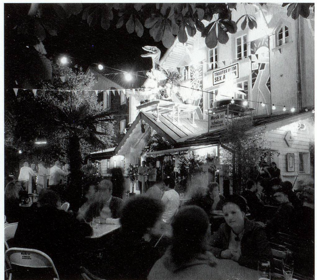
Café Bar Mokka

toren bespielen. Im Frühjahr 2000 übernahm dann die vorher an der Kunsthalle Basel tätige Madeleine Schuppli das Haus, entstaubte es endgültig und brachte es mit einer spannenden Programmierung unter die führenden Kunstmuseen in der Schweiz. Der ausgewogene Mix musealer Sammlungspräsentationen und Kunsthalle-ähnlicher, internationaler Ausstellungen weiss zu überzeugen, was sich an den Besucherzahlen und dem allgemeinen Medienecho deutlich ablesen lässt. Zudem wurden die Räume unter Schupplis Leitung komplett saniert und für eine zeitgemässe Museumsnutzung hergerichtet 7 . Das Haus bildete fortan das Zentrum des künstlerischen Interesses und lockte erstmals in seiner Geschichte auch ein nationales und internationales Publikum an.