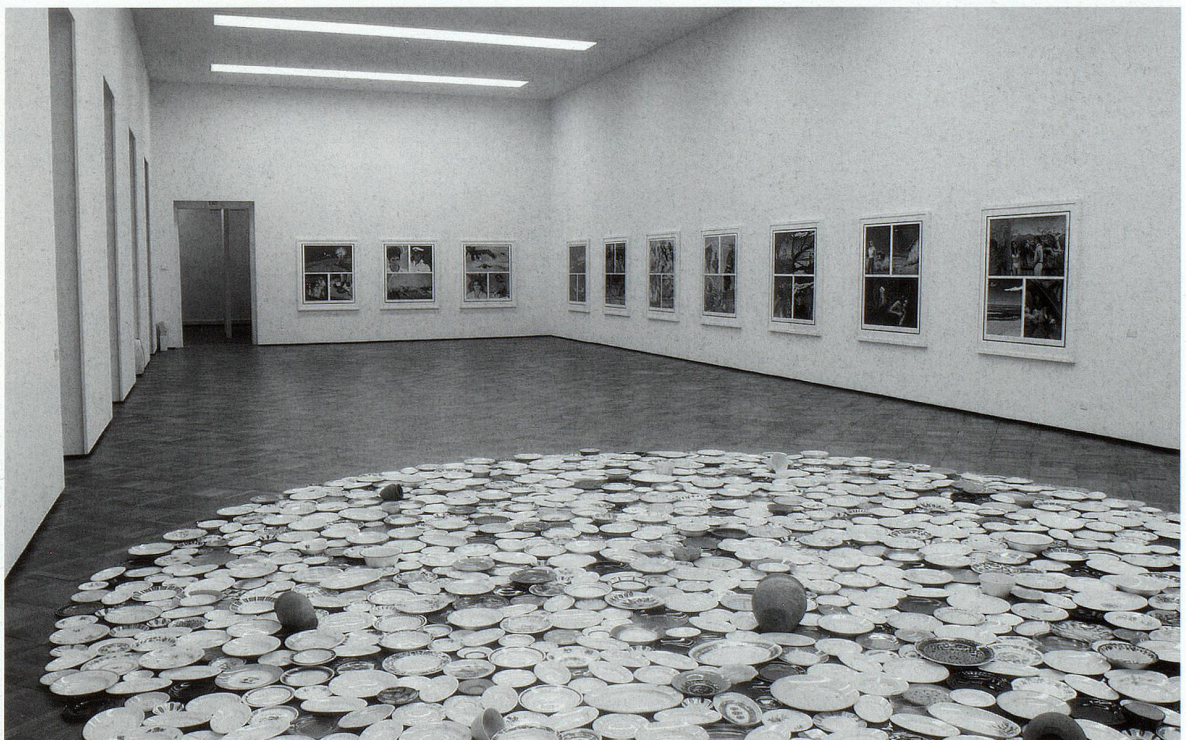
Ausstellung (Hi)Story im Kunstmuseum Thun 2005, Arbeiten von Tracy Moffatt (Wände) und Richard Wentworth (Boden), Foto: Christian Helmle