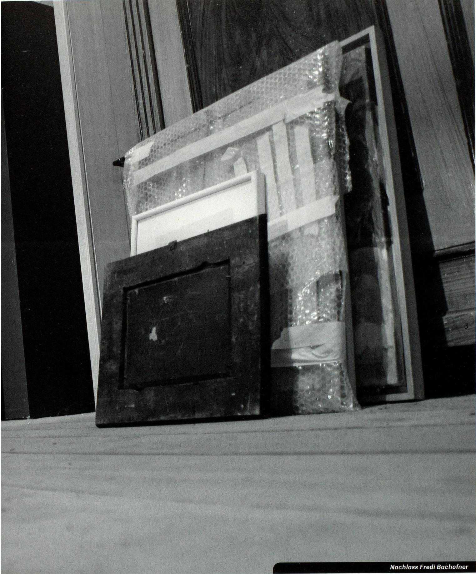
Nachlass Fredi Bachofner