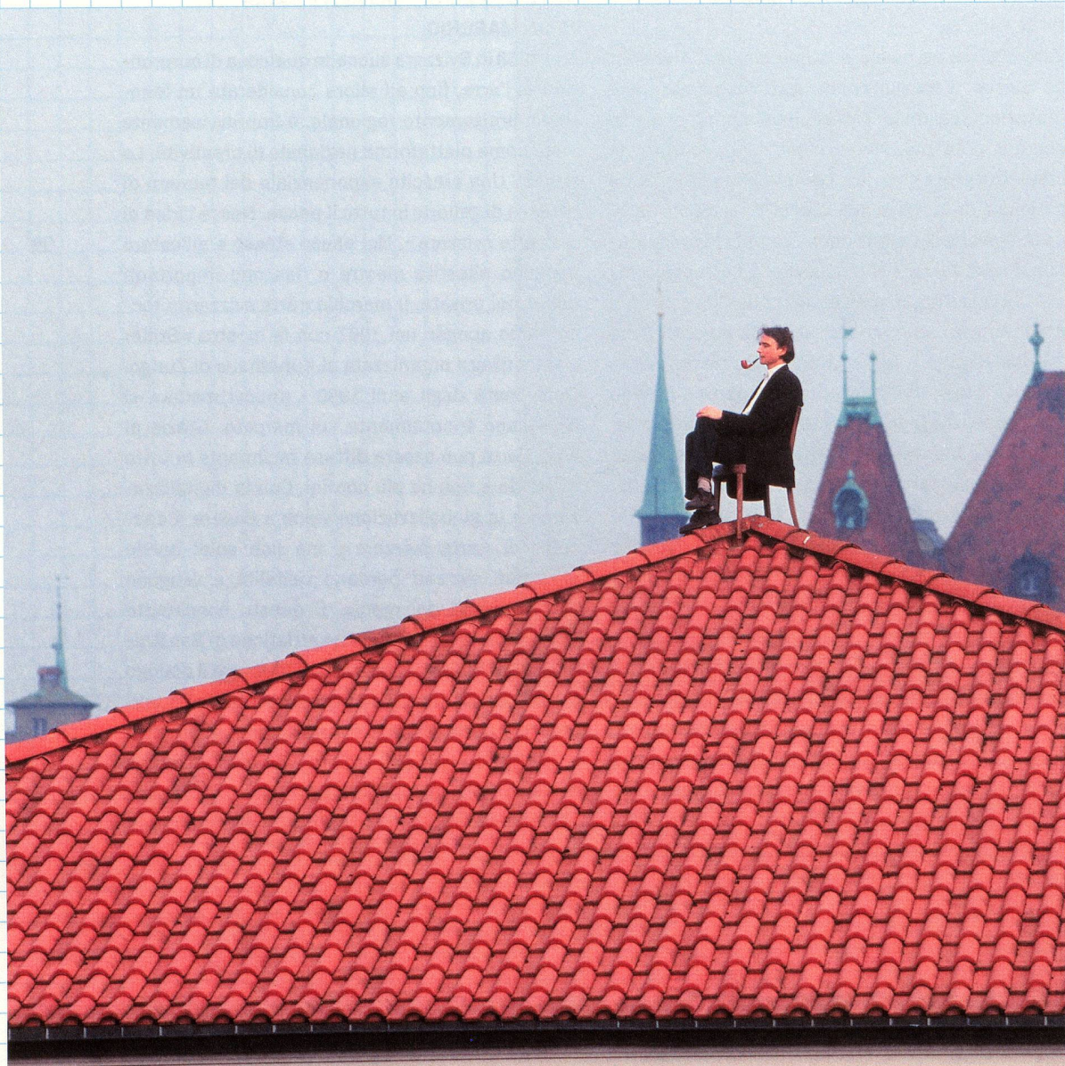
besitzen Christoph Rütimann 1999, Kunsthalle Bern ©Christoph Rütimann/ProLitteris, Zürich