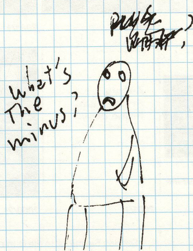
Abbildung aus dem Buch: Dan Perjovschi, «I Am Not Exotic, I Am Exhausted», 2008