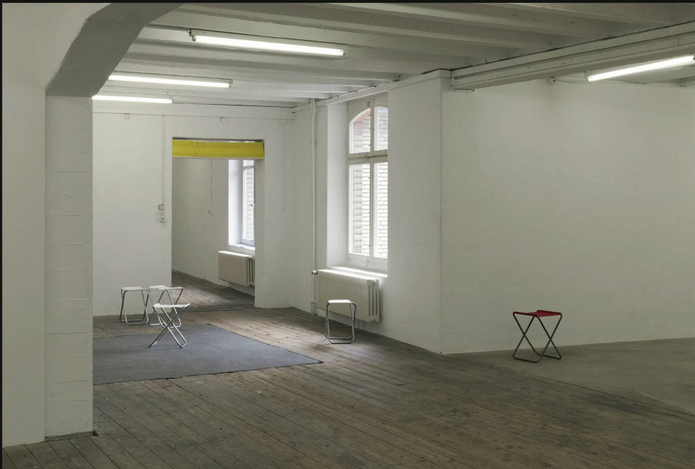
Sophie Nys, Sitzen ist das neue Rauchen , 2015, Ausstellungs- ansicht Stiftung Binz39, Zürich