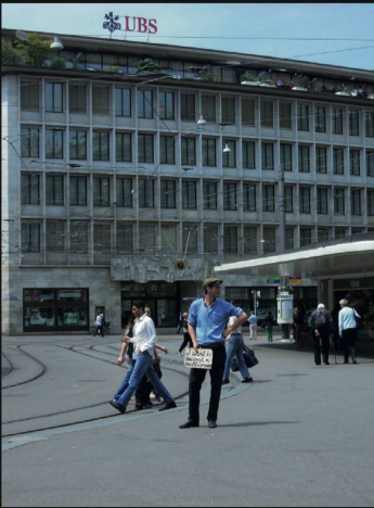
Thomas Geiger, I want to become a millionaire , 2012, Art and the City, Zürich, Foto: Astrid Seme