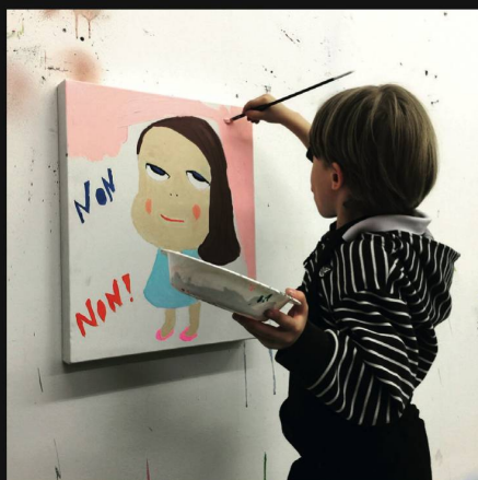
Ateliers REAL/FAKE tout public, adultes et enfants