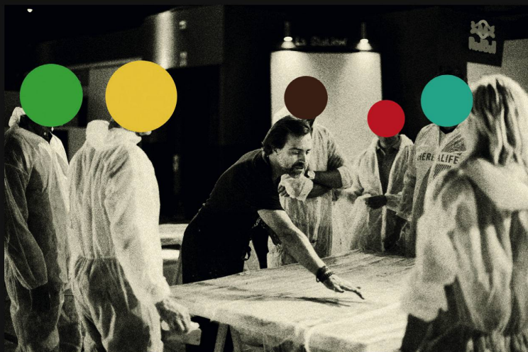
Team Building pour 70 personnes de chez Audemars Piguet en 2017, photographie retouchée à la façon de l'artiste conceptuel John Baldessari