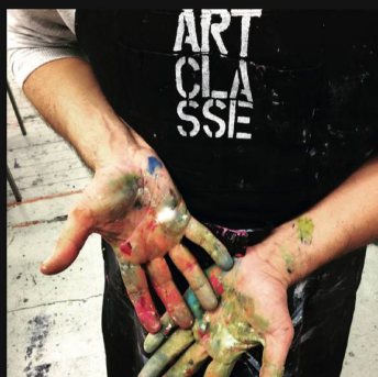
Participant d'un atelier REAL/FAKE