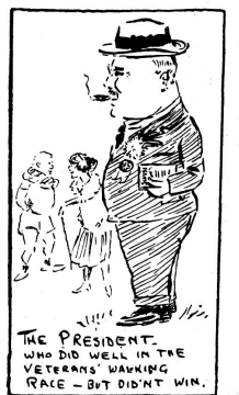
THE PRESIDENT WHO DID WELL IN THE VETERANS' WALKING RACE - BUT DIDN'T WIN.

Before leaving the more serious contests, mention must be made of the children's races, to them, at least, the most serious business of the afternoon. One un-