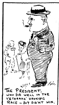
THE PRESIDENT WHO DID WELL IN THE VETERANS' WALKING RACE - BUT DIDN'T WIN.