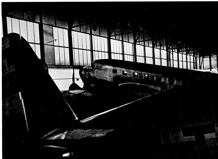
At Night the Big Birds are "At Rest."

Welch Wunderwerk ist die Steuermechanik mit all den Hebeln, Stangen, Wellen, Seilzügen, Rollen, Ketten, Trommeln und Spindeln. Wie viele Leitungen, Züge, Gestänge etc. sind für die Motorenregulierung nötig! Da ist ein hydraulisches System, das die Landeklappen und das einziehbare Fahrgestell bedient und bewegt. All das wird zerlegt und revidiert. Neu gedichtet muss es nachher wieder an seinem Platz sitzen. Und wer wusste denn, dass feste Verbindungen, Nieten, Schweissstellen, Schrauben nicht nur mit dem unbewaffneten Auge, sondern auch mit Lupen