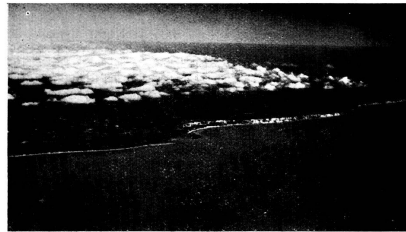
Folkestone, first view of the English coast.

Gelegenheit haben, einen solchen Werkstättenbesuch machen. Nicht nur des unbedingten Vertrauens wegen, das da wächst und des Glaubens an die grosse Zukunft des Luftverkehrs wegen, sondern auch, weil diese Stunden eine wirkliche Entdeckerfahrt in das Reich schweizerischer Werkmannsarbeit und handwerklicher Meisterschaft waren, welche von jeher die Grundlage des stolzen Rufes schweizerischer Qualität waren.