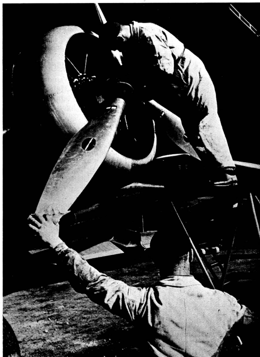
Control of Propeller.