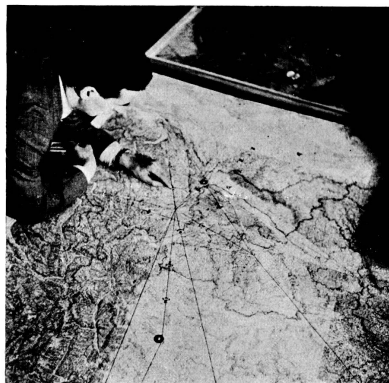
Ing. Meyer an der Verkehrskontrollkarte. Die Positionen der Zürich anfliegenden Flugzeuge sind durch Pappmodelle festgehalten, so dass der Verkehrskontrolleur einen genauen Ueberblick über die Dübendorf berührenden Maschinen hat.

Kollisionsgefahr mit andern Maschinen auszuschliessen. Die in der Luft befindlichen Verkehrsflugzeuge pflegen sich gegenseitig durch ihre Funkstation miteinander über die Route und Flughöhe zu verständigen, doch fehlt ihnen naturgemäss die genaue Uebersicht, wie sie der Verkehrskontrolleur am Boden auf der Verkehrskontrollkarte besitzt. Er wird ihnen also auf funktelegrafischem Wege Weisungen erteilen über einzuhaltende Flughöhe und Geschwindigkeit etc.