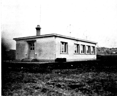
Aussenansicht der Verkehrskontrollstation Dübendorf.