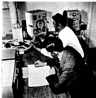
Der Funker am Nahzonenpeiler. Im Hintergrund rechts das Bakenkontrollgerät zur Betätigung der Blindlandeanlage.

Es sei hier noch hinzugefügt, dass die hier skizzierte Verkehrskontrolle nur bei schlechtem Wetter voll in Kraft tritt .