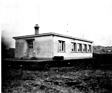
Aussenansicht der Verkehrskontrollstation Dübendorf.