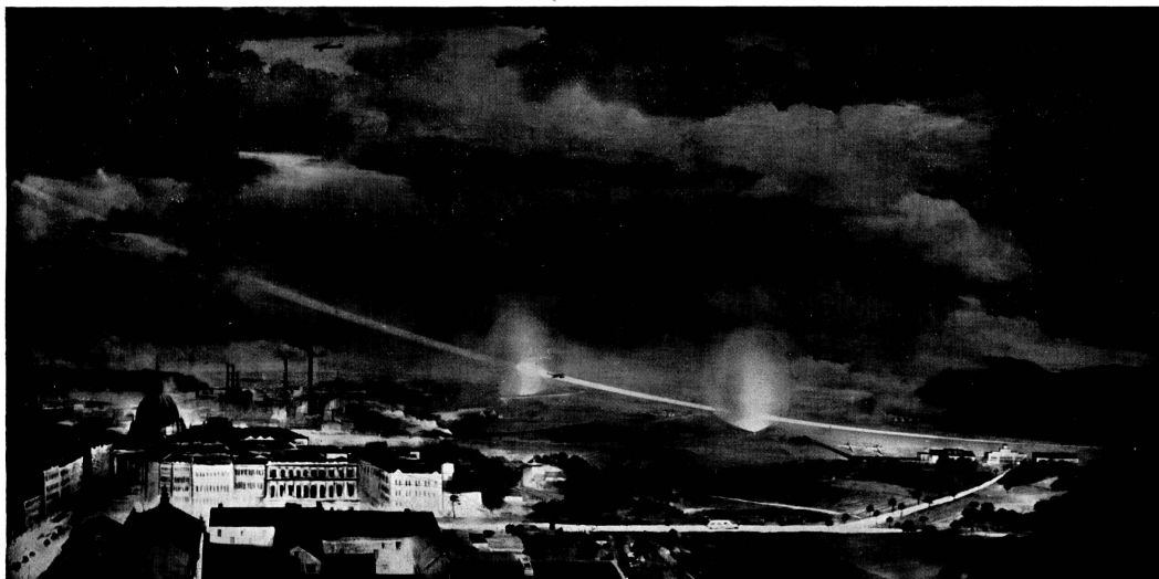
Bei der Schlechtwetteranlage wird ein Bakensender verwendet, der abwechselnd ein Punkt- und ein Strich-Diagramm aussendet. Im Bereich gleicher Feldstärke dieser beiden Diagramme entsteht eine Schneise, die als Einflogstrasse dient. Auf dieser Schneise (Sendestrahl) kann das Flugzeug ohne Bodensicht den Flughafen sicher erreichen. Ein Vor- und ein Hauptsignal zeigen dem Flugzeugführer an, wie weit er noch vom Flughafen entfernt ist.

Damit ist ein weiteres grosses Hindernis des regelmässigen Luftverkehrs, der Nebel, zum grossen Teil überwunden worden.