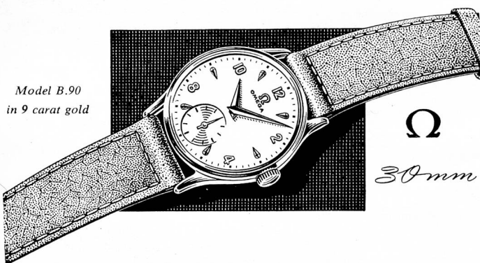
Model B.90 in 9 carat gold

OLYMPIC GAMES — For 20 years Omega has timed the Olympic Games. Again the most exacting and impartial experts have chosen Omega to time the 1956 Olympics in Melbourne, Australia. This is the highest recognition any watch has ever received from the countries of the world.