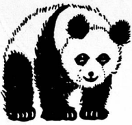
Regd. Trade Mark

... because they are made under Swiss management. You will agree when you see the wonderfully gay check, spotted, striped or tartan Hair Ribbons, in all widths and colours, and the other fine-quality PANDA lines for millinery, corsetry and tailoring.