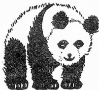
Regd. Trade Mark

Everyone adores them they're so so gay and colourful in a variety of designs :— stripes, spots, checks and tartans. Also self colours in satins, taffetas, failles and petershams. Ask for "Panda" and know you are buying the best.