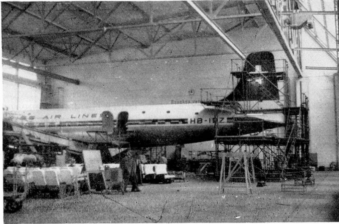
A Swissair plane in the maintenance dock where wings, fuselages and control surfaces are regularly examined and maintained.

given to increasing the frequency of services to the Middle East.