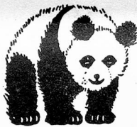
Regd. Trade Mark

Everyone adores them they're so so gay and colourful in a variety of designs:— stripes, spots, checks and tartans. Also self colours in satins, taffetas, failles and petershams. Ask for "Panda" and know you are buying the best.