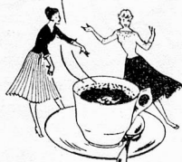
Nescafé is a registered trade mark to designate Nestlé's instant coffee.