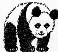
Regd. Trade Mark

Everyone adores them they're so so gay and colourful in a variety of designs:— stripes, spots, checks and tartans. Also self colours in satins, taffetas, failles and petershams. Ask for "Panda" and know you are buying the best.