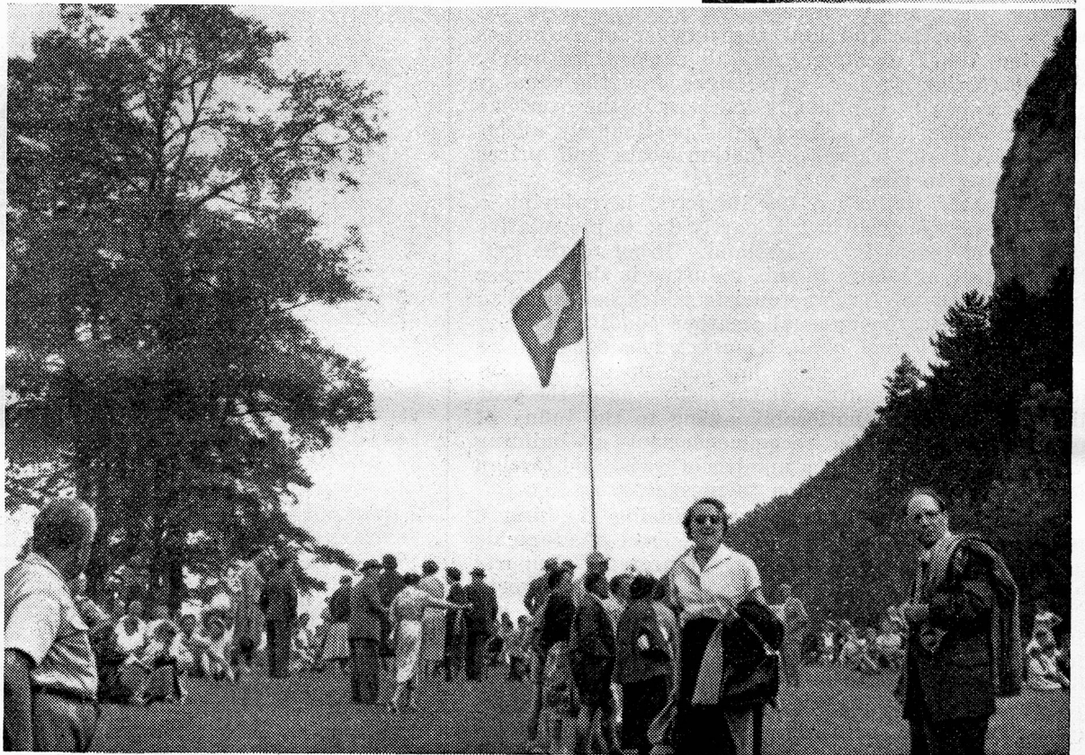
After a memorable excursion on the lake of Lucerne aboard "Schiller", our guests from abroad went to the Rütli to celebrate the 1st of August at the spot where the Confederation was born.