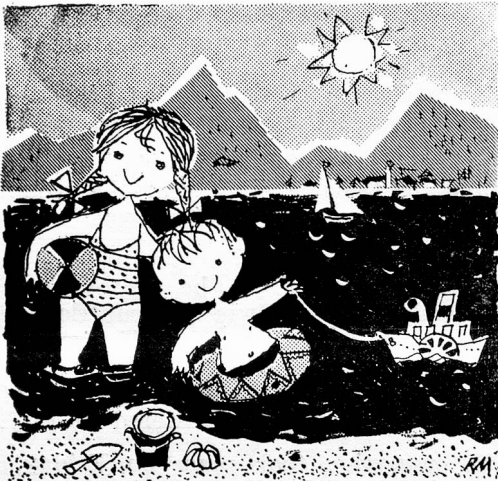
Swiss National Tourist Office, 458, Strand, London, W.C.2