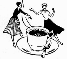
Nescafé is a registered trade mark to designate Nestlé's instant coffee.