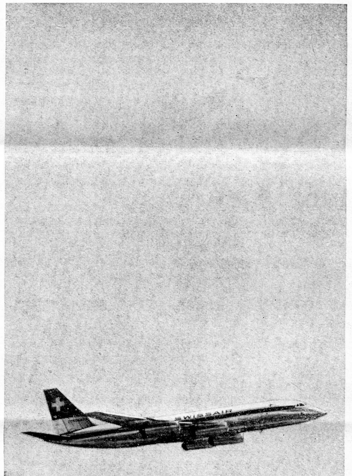
*IN ASSOCIATION WITH B.E.A.

THROUGHOUT THE WORLD ARE SERVED BY BIG, FAST SWISSAIR JETS INCLUDING THE CORONADO—THE WORLD'S MOST ADVANCED PASSENGER JET. DAILY CARAVELLE FLIGHTS FROM *LONDON TO ZURICH AND GENEVA CONNECT WITH SWISSAIR'S WORLD-WIDE JET NETWORK. SWISSAIR SERVICE IS LEGENDARY—PROVE IT FOR YOURSELF NEXT TIME YOU GO ABROAD.