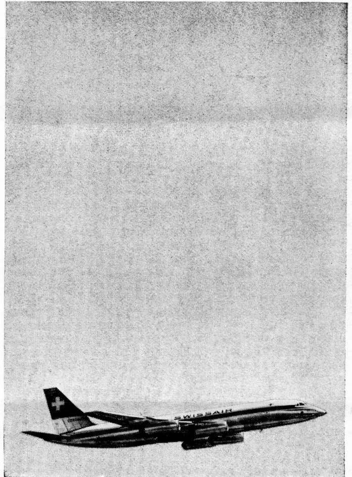
*IN ASSOCIATION WITH B.E.A.