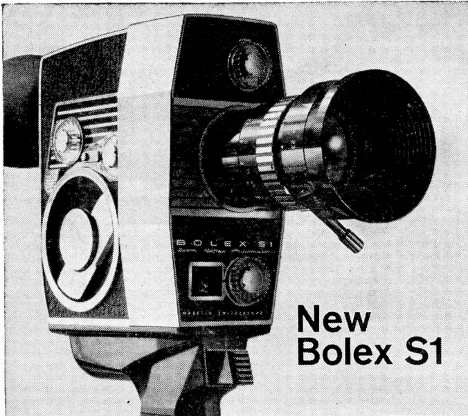
New Bolex S1

The new Bolex S1 zoom reflex camera is fitted with automatic exposure control. The camera also has a very fine 9-30mm f/1.8 zoom lens, a variable shutter, three filming speeds (coupled to the automatic exposure control system), film backwind, single frame filming, geared footage counter and an integral pistol grip. The price is £99.19.6. See this and other fine Bolex zoom cameras (prices start at £79.12.8.) at your accredited Bolex dealer's showroom.