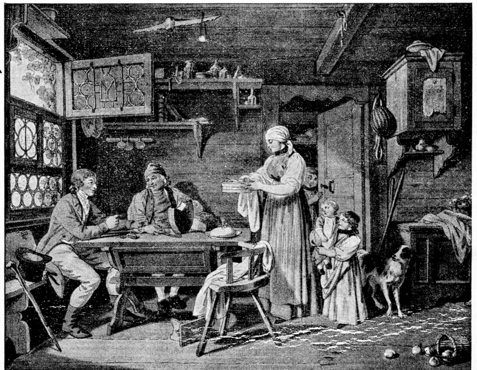
Sigmund Freudberger, Bern, 1745—1801