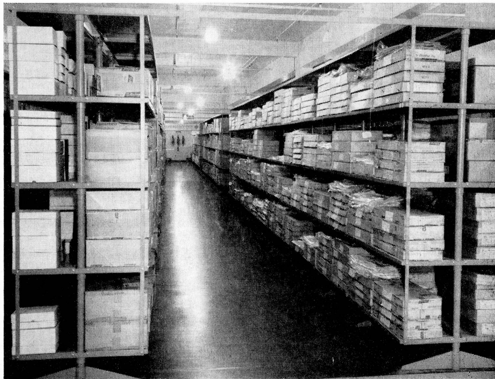
The illustration shows Acrow Cantilever Shelving installed in the Guildford branch stockroom of Marks & Spencer Ltd.

J. B. REYNIER LIMITED 16-18 TACHBROOK STREET LONDON, S.W.1 VICtoria 2917/18