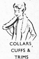
COLLARS, CUFFS & TRIMS

"Velcro" touch and close fastener (a Swiss inven- tion) is made of two Bri- nylon strips which grip firmly at a touch, yet easily peel apart. "Velcro" can be cut with scissors to any length. You can sew it on by hand or machine. It can be washed and dry-cleaned. Can- not jam or rust.