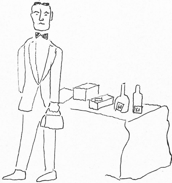
City Swiss Club Ball