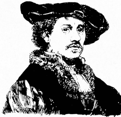
REMBRANDT HARMENSZOOM VAN RIJN, 1606-1669. Dutch painter and etcher.

Araldite® epoxy resins made by Ciba-Geigy's Plastics Division and familiar to the general public as adhesives, are an essential ingredient in the production of electrical and electronic components.