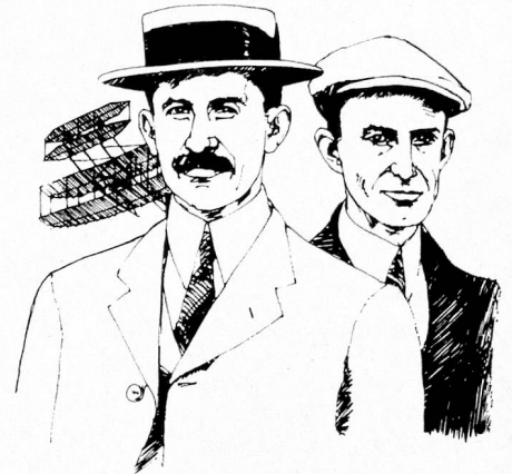
ORVILLE AND WILBUR WRIGHT, 1871-1948 and 1867-1912.

Pigments Division manufactures a wide range of lightfast, durable pigments, used in the production of high quality artists' colours. The division is also a leading supplier of organic pigments and dyes to the other colour-using industries.