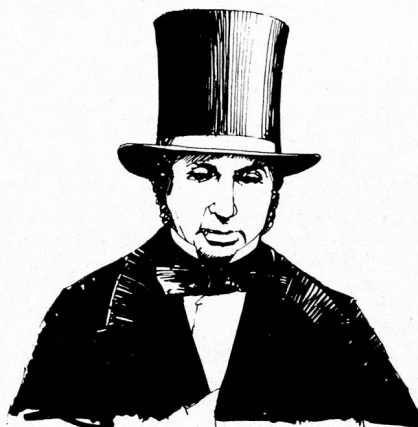
ISAMBARD KINGDOM BRUNEL, 1806-1859. English civil engineer.

Ciba-Geigy's Plastics Division is Britain's largest manufacturer of synthetic resin adhesives. Aerolite® urea resins, long established as outstanding wood glues, find their biggest use in the manufacture of chipboard and plywood, for veneering and all types of joinery.