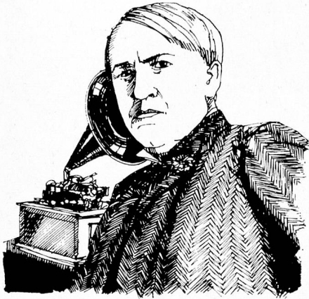
THOMAS ALVA EDISON, 1847-1931. American inventor, especially of electrical devices.

Araldite® epoxy resins made by Ciba-Geigy's Plastics Division and familiar to the general public as adhesives, are an essential ingredient in the production of electrical and electronic components.