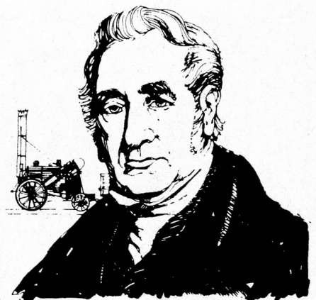
GEORGE STEPHENSON, 1781-1848. English inventor and engineer.

Foundry Chemicals Division, a subsidiary of Plastics Division, is a leading supplier of specialised chemicals for the foundry industry. The products include resins, silicates, hardeners, acid catalysts, conventional oil sand binders, facing materials and foundry paints.