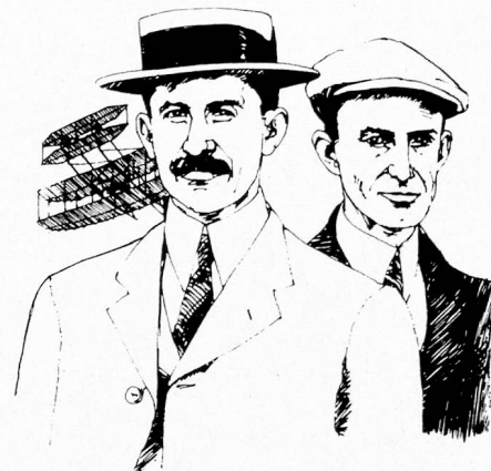
ORVILLE AND WILBUR WRIGHT, 1871-1948 and 1867-1912. American aeronautical inventors.

Pigments Division manufactures a wide range of lightfast, durable pigments, used in the production of high quality artists' colours. The division is also a leading supplier of organic pigments and dyes to the other colour-using industries.