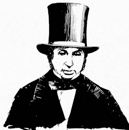
ISAMBARD KINGDOM BRUNEL, 1806-1859. English civil engineer. Foundry Chemicals Division, a subsidiary of Plastics Division, is a leading supplier of specialised chemicals for the foundry industry. The products include resins, silicates, hardeners, acid catalysts, conventional oil sand binders, facing materials and foundry paints.

Ciba-Geigy's Plastics Division is Britain's largest manufacturer of synthetic resin adhesives. Aerolite® urea resins, long established as outstanding wood glues, find their biggest use in the manufacture of chipboard and plywood, for veneering and all types of joinery.