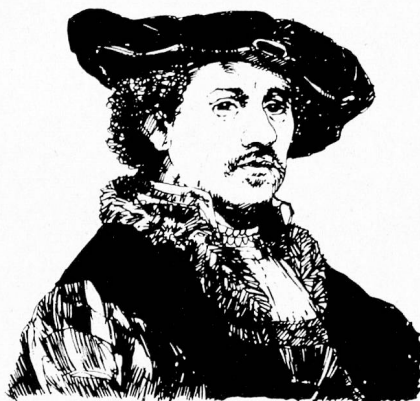
REMBRANDT HARMENSZOOM VAN RIJN, 1606-1669. Dutch painter and etcher.

Araldite® epoxy resins made by Ciba-Geigy's Plastics Division and familiar to the general public as adhesives, are an essential ingredient in the production of electrical and electronic components.