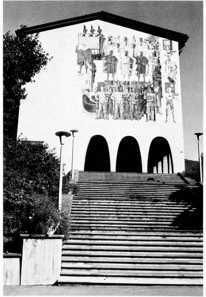
The facade of the Swiss Federal Archive building in Schwyz has a huge mural depicting the swearing of the allegiance. It was painted by Heinrich Danioth in 1936.