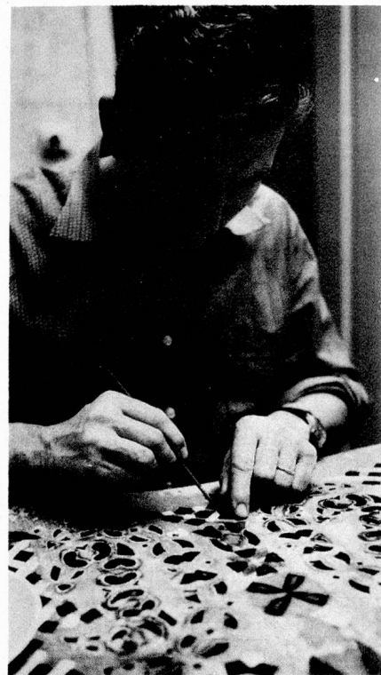
The punched out ornaments are carefully backed with coloured paper.

Luckily, this custom is not destined to disappear. The Nicholas Society fathers, school teachers, all teach the children at an early age how to make at least a small and light copy of an "Yffel". With the pride of grown-ups even the youngest among them carry their mitre around during an afternoon procession on the same day.