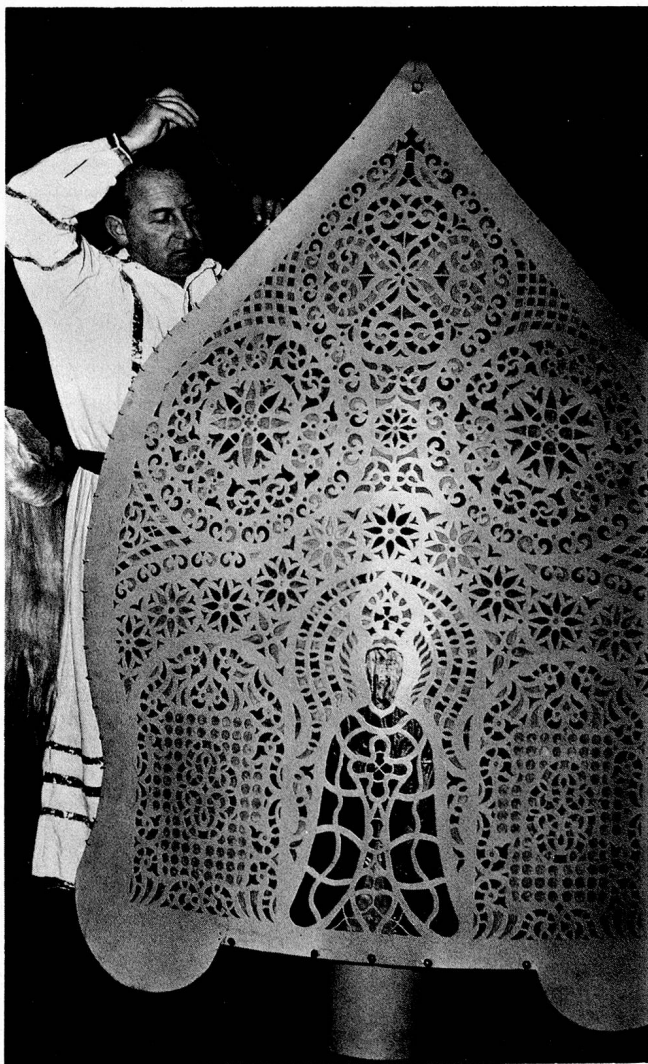
Shortly after 8 p.m. on 5th December comes the great moment — the candles are lit.