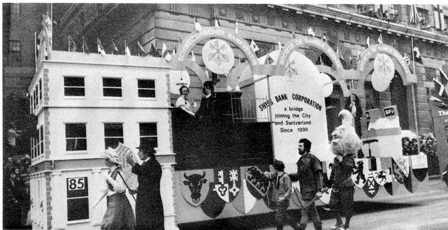
The Swiss Bank Corporation's float near the Mansion House on its outward journey.

Walking on each side of the float were a couple in Victorian dress, William Tell, complete with crossbow, son Walter (and an apple) and also a gnome which appeared to have come straight over from a Zürich garden. The rôles were played by members of the Swiss Bank Corporation, the two Walter Tells being the twin sons of one of the William Tells.