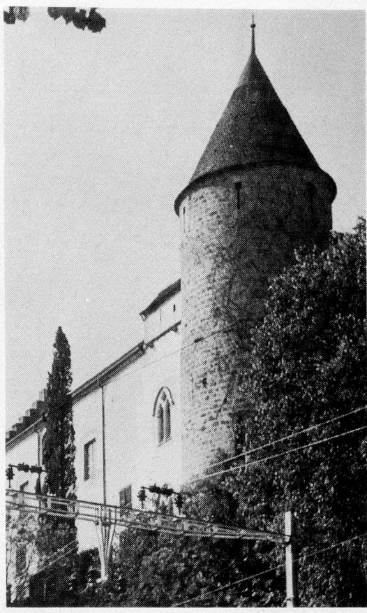
A Vaud castle that faces the 'invaders' — Page 7