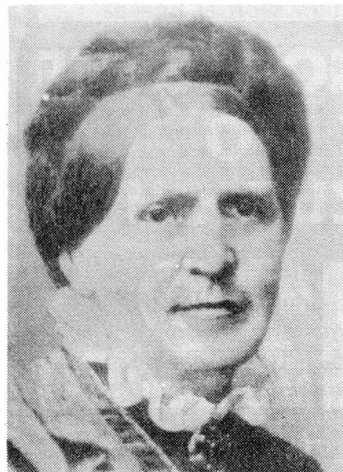
Johanna Spyri, author of Heidi , one of the most popular children's books ever written.

The 26 part series, shot on location in the Engadine resort