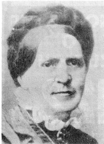
Johanna Spyri, author of Heidi , one of the most popular children's books ever written.

The 26 part series, shot on location in the Engadine resort