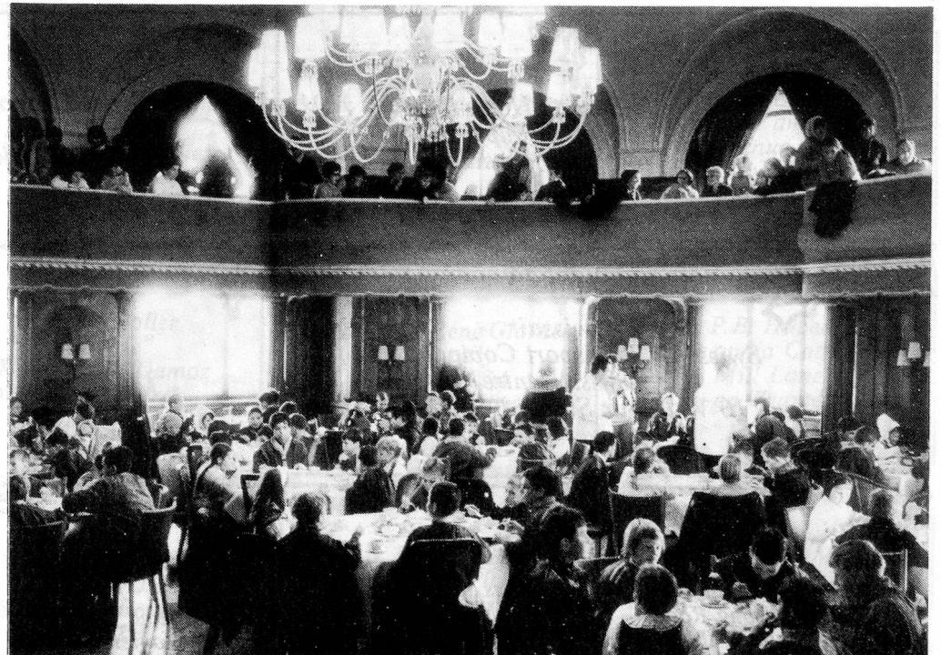
... and afterwards - a fine old feed