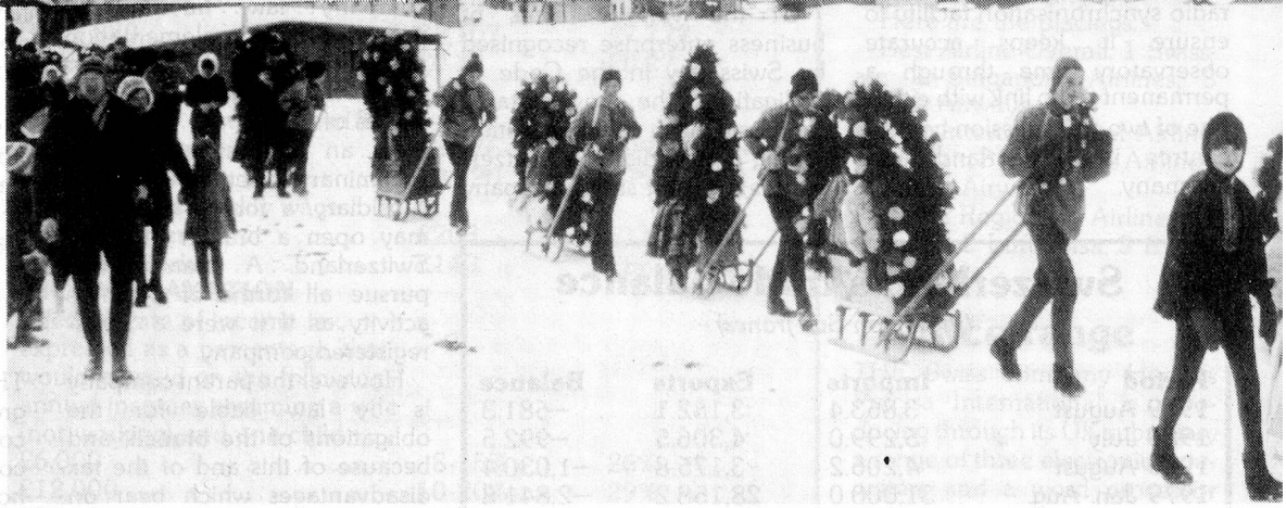
The big day begins ... up to fifty gaily decorated toboggans commence the grand parade.