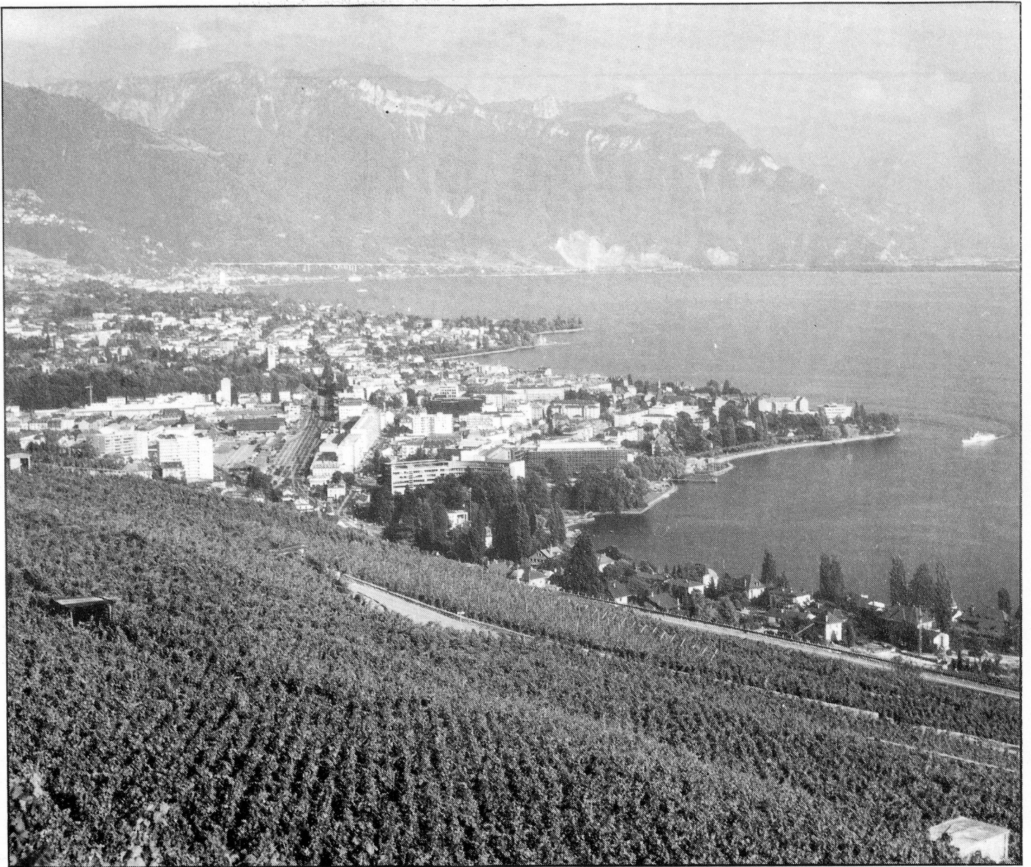
Vevey and Montreux lie between two wine growing areas in a region which was producing wine 1,000 years ago.