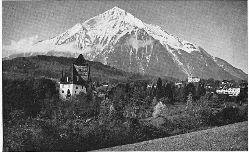
Spiez mit dem Niesen / Spiez et le Niesen

Eines schönen Tages brachte mich die Alpenbahn dem Thunersee entlang hinauf bis zu dem hoch und wuchtig vom Niesen, dieser Trutzburg, beschirmten Spiez. Noch hatte der stolze Berg seinen Hermelinmantel, doch warf die Sonne ihre letzten jubelnden Lichter darüber hin, so dass der Berg funkelte wie mit tausend Diamanten übersät. Und am andern Morgen zog ich in das idyllische, stille Simmental. Bald ruhte das Auge entzückt auf dem Dorfe Wimmis, dessen Schloss mit Kirche traulich an den Absturz der Bergfluh lehnt und gleichsam als treuer Wächter den Eingang in die Talschaft sperrt. Die Lage des Ortes ist äusserst malerisch und die Feste trägt den Charakter einer mittel-