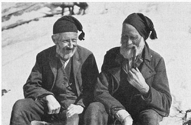
Bergbauern aus dem Oberland Types d'Oberlandais