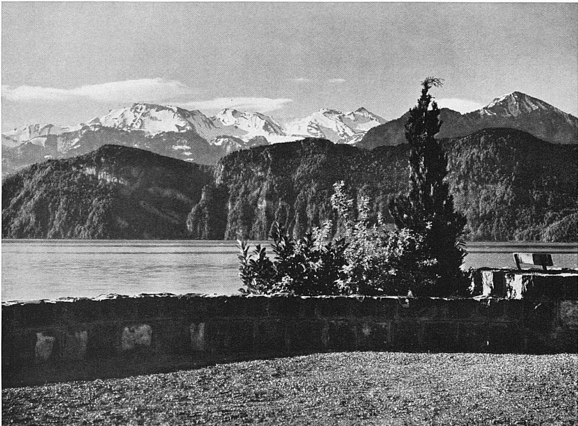
Am Quai von Weggis / Quai de Weggis

Dichter sind schon oft die Pioniere des technischen Fortschritts geworden. Damals, als Schiller mit seinem « Tell » die klassischen Stätten am See belebte, sauste noch keine elektrische Gotthardlokomotive rauchfrei durch die Tunnels der Axenstrasse hart dem Wasser- saume des Vierwaldstättersees entlang. Noch keine der