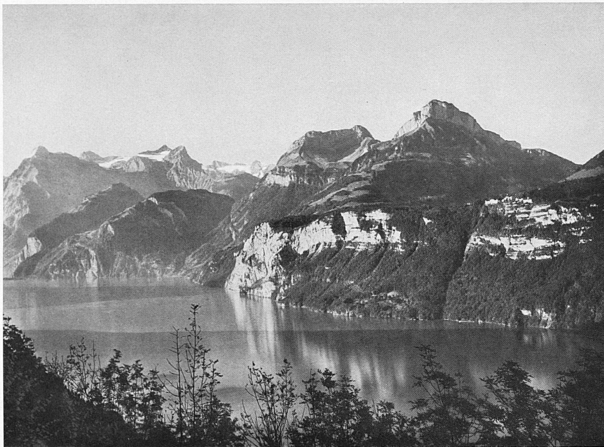
Urnersee mit Urirotstock und Seelisberg / Le lac au pied de l'Urirotstock et Seelisberg

Pilatus und Rigi flankieren, wie schon vor ungezählten Tausenden als selbständige Steinkolosse dieses Hochgebirgshalbrund um den See. Dazwischen lagern trotzig, um nur die bekanntesten zu nennen, das Stanser-