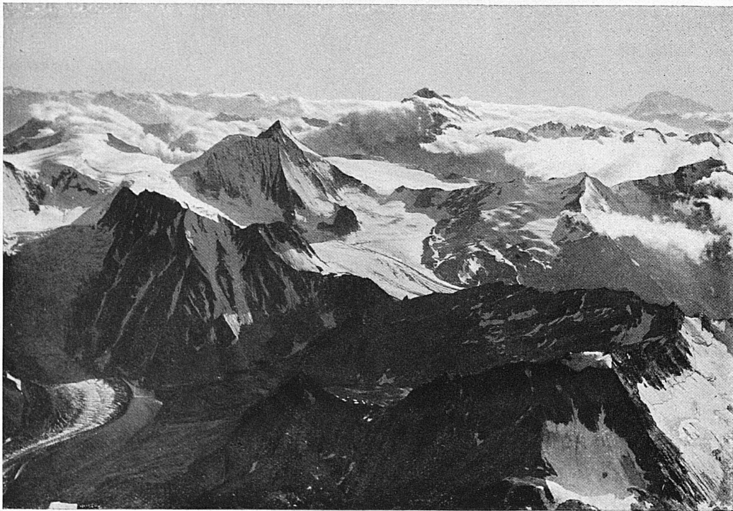
In den Walliser Alpen / Dans les Alpes valaisannes