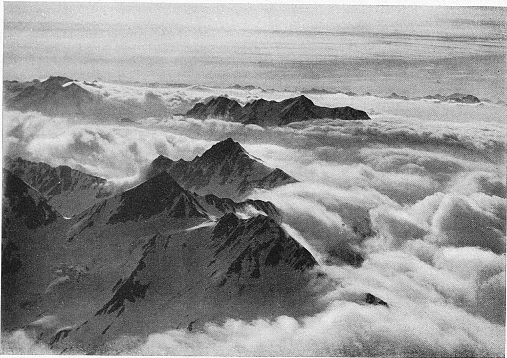
In den Bündnerbergen / Dans les montagnes des Grisons