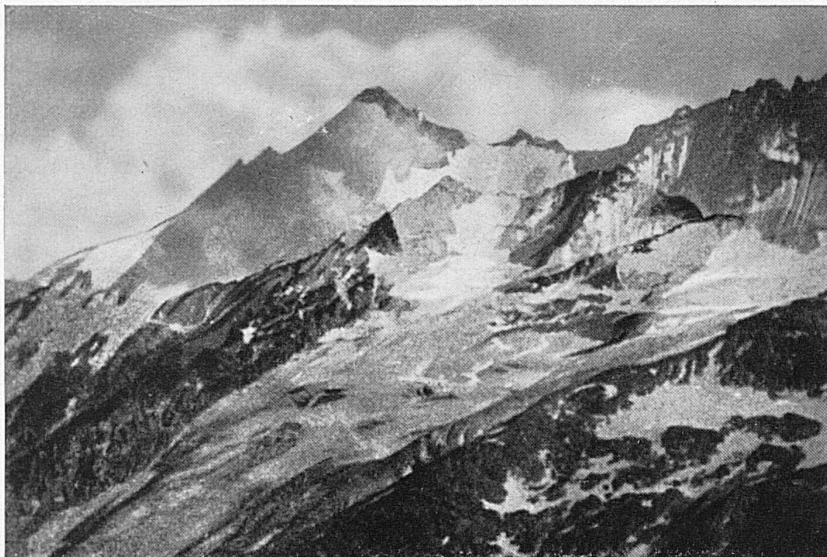
Am Simplon / Une partie du Simplon

gangenheit als Namen, der von den Gestaden des blauen Genfersees nach Aosta und Turin hinüberführt. Die Strecke Orsières (im Wallis) bis Aosta wird vom Automobil bedient.