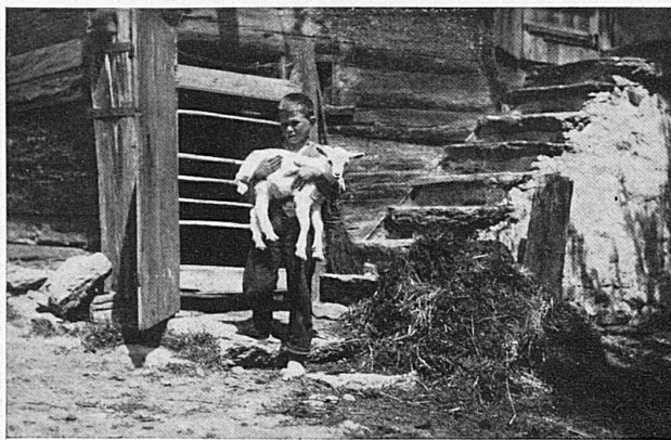
Ein Gomserbub / Un jeune chévrier

Einem besinnlichen Wanderer wird auch die Lukmanierstrasse (von Disentis nach Acquarossa) oder die Bernhardinstrasse (von Thusis nach Mesocco) nicht zu lange erscheinen. Und wenn gar die «Wanderung» mit Hilfe des komfortablen