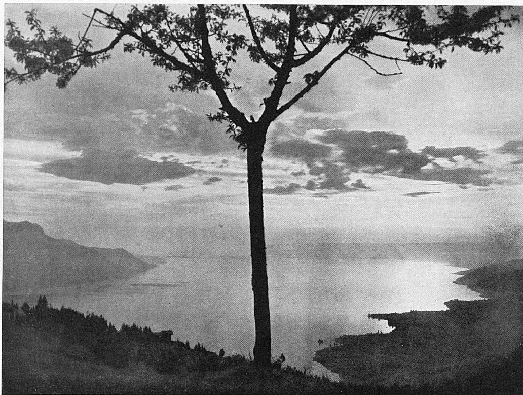
Abendstimmung über dem Genfersee / Un soir sur le lac Léman