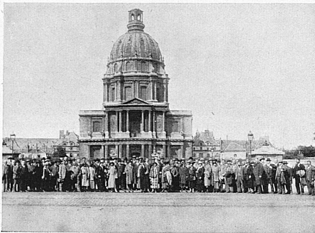
Teilnehmer einer Studienreise vor dem Invalidendom in Paris Les participants à un voyage d'étude devant le dôme des Invalides à Paris

an der zweiten 376 Personen teil. In Paris fanden nebst dem Besuch der Internationalen Kunstgewerblichen Ausstellung, verbunden mit einer Zusammenkunft mit dem Schweizerverein, eine Stadtrundfahrt mit Besichtigung verschiedener historischer Stätten, ein Ausflug nach Fontainebleau mit Schlossbesuch und ein Ausflug nach Versailles, ebenfalls mit Schlossbesuch, statt. Besonders genussreich gestaltete sich die Reise nach Belgien und Holland. Die Teilnehmer dieser Reise werden un-