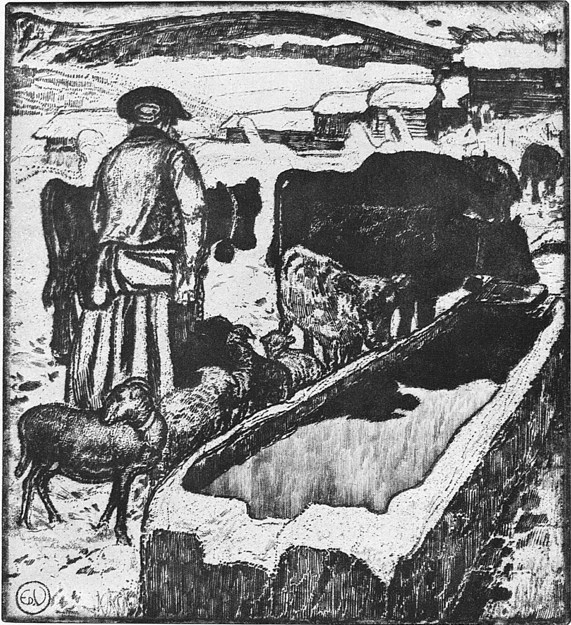
Herde bei der Tränke Von Vallet