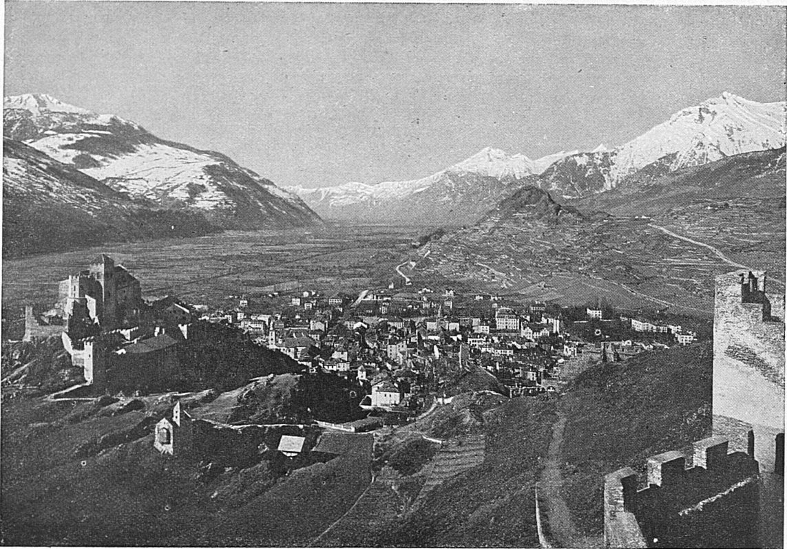
Sion / Sitten